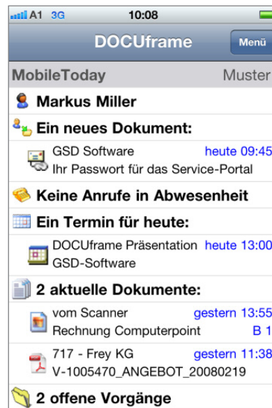
Startbildschirm „MobileToday“ im iOS Client

Bei Nutzung des Apple Betriebssystems besteht in jeder Ansicht die Möglichkeit zum „Pull to Refresh“. Das heißt, Sie aktualisieren Ihre Daten indem Sie die mobile Seite einfach nach unten ziehen.