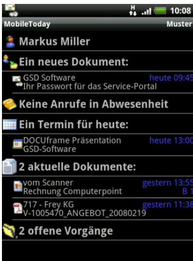
Startbildschirm „MobileToday“ im Android Client